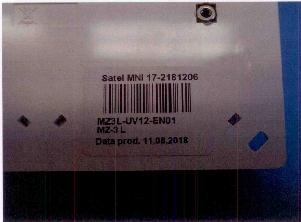
Modul montážních svorek MZ-3 L