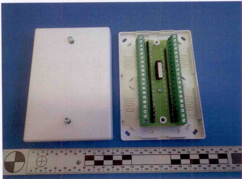
Modul montážních svorek MZ-3 L