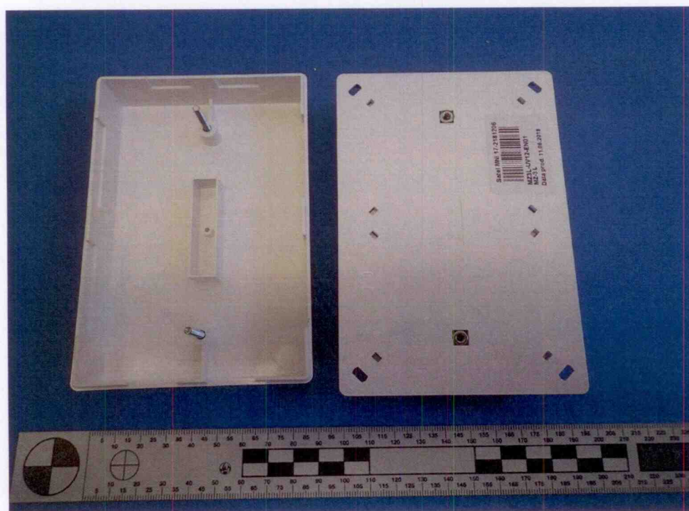
Modul montážních svorek MZ-3 L